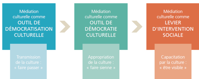
FIGURE 1 – CONTINUUM DE LA PRATIQUE DE MÉDIATION CULTURELLE OBSERVÉ DANS CULTURES DU CŒUR

« Nous remarquons que la médiation culturelle est employée selon plusieurs sens par les acteurs œuvrant autour de Cultures du cœur, depuis le sens traditionnel du terme, c'est-à-dire en termes de démocratisation et de démocratie culturelles, jusqu'à une utilisation d'une médiation culturelle comme levier d'intervention sociale visant la capacitation des personnes ».